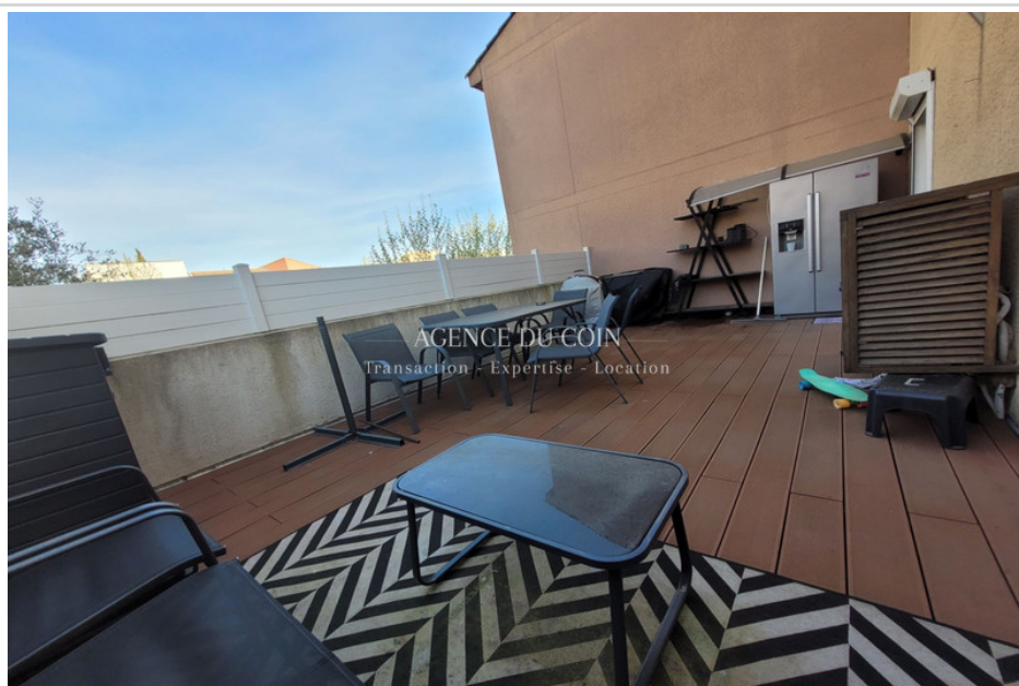
Appartement Le Muy